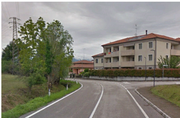
Foto 3I - vista da via Tiepolo