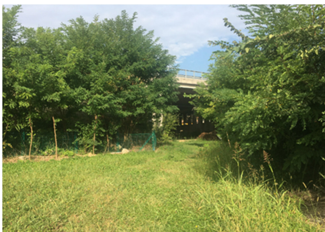
Foto 3M - vista da Est sottopasso A27