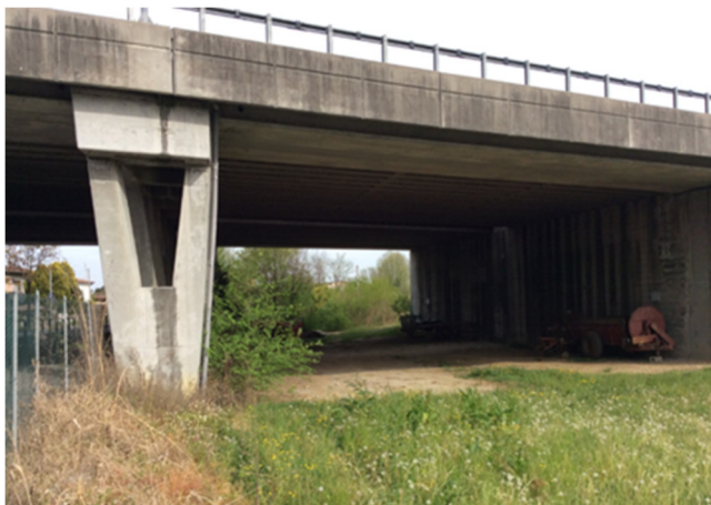
Foto 3O - vista da Ovest sottopasso A27