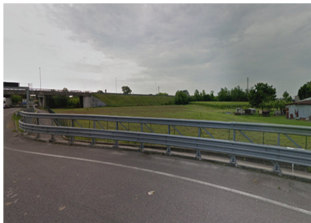
Foto 3P - vista area agricola ad Ovest del sottopasso A27