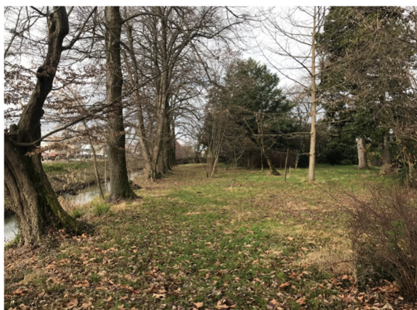
Foto 1E - vista da Ovest, giardino Villa Paoletti