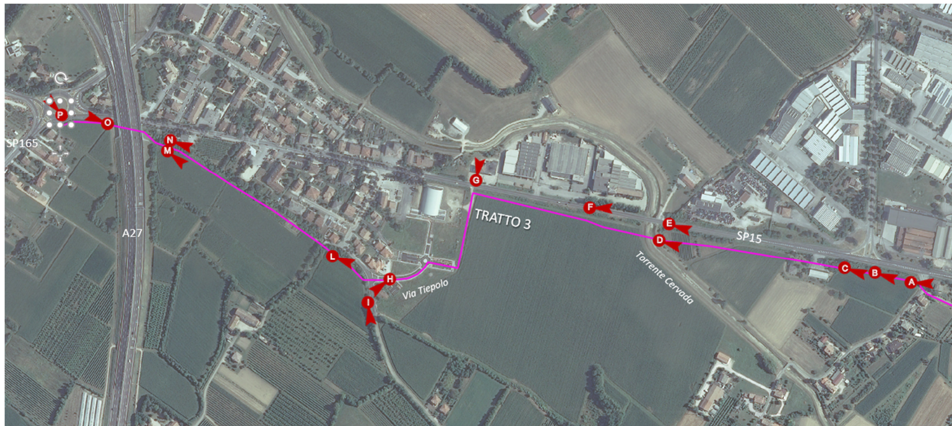
Figura 3 – coni visuali su ortofoto - Via San Felice – Rotatoria via Ungheresca