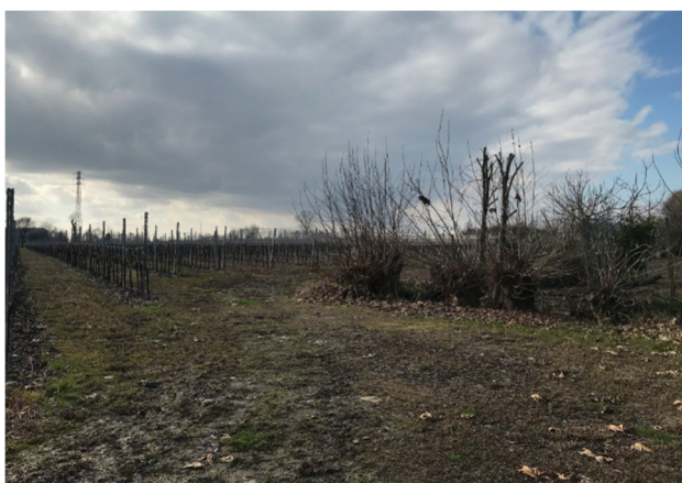
Foto2E - vista area agricola