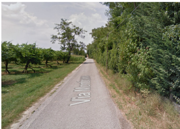
Foto2O – via Monticano