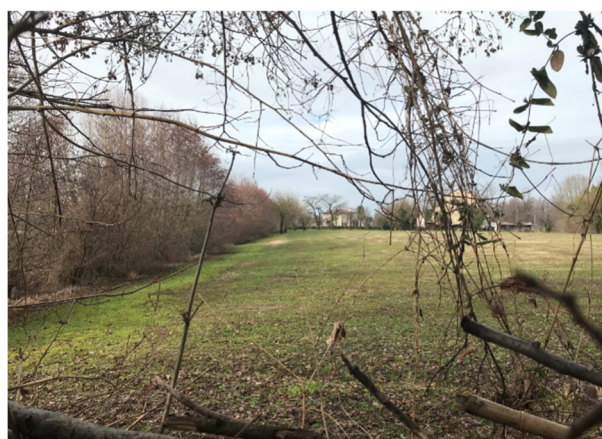
Foto 1F - vista da Est, proprietà ad Ovest della Villa Paoletti