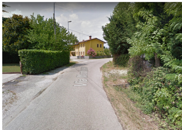
Foto2P – via Monticano