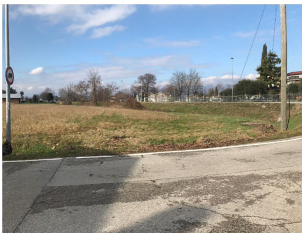
Foto2S - via Monticano