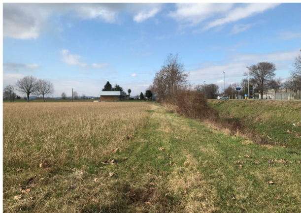
Foto3A – area agricola ad ovest via San Felice