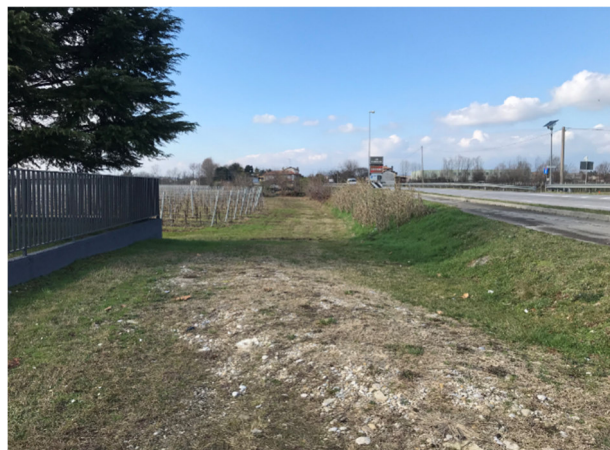
Foto2B - vista dalla SP15, attraversamento