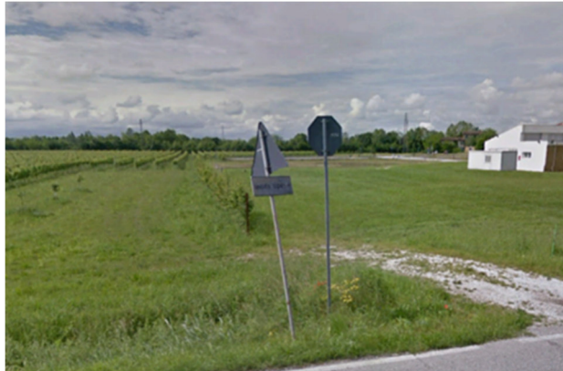
Foto 3G - vista dalla SP15, area agricola