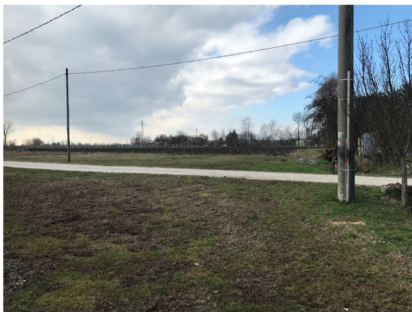
Foto2G – vista area agricola