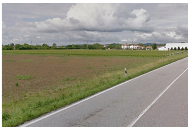
Foto3F – vista dalla SP15, area agricola