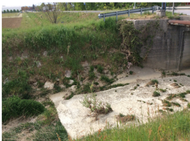
Foto3D - torrente Cervada