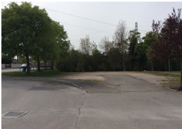
Foto 1A - vista dal piazzale della chiesa