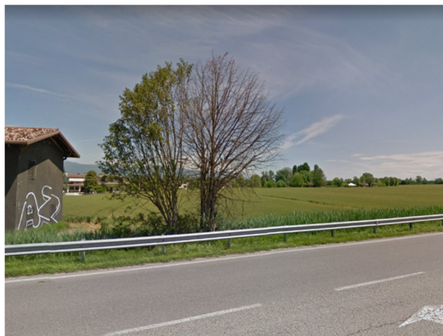
Foto1P – vista da SP15