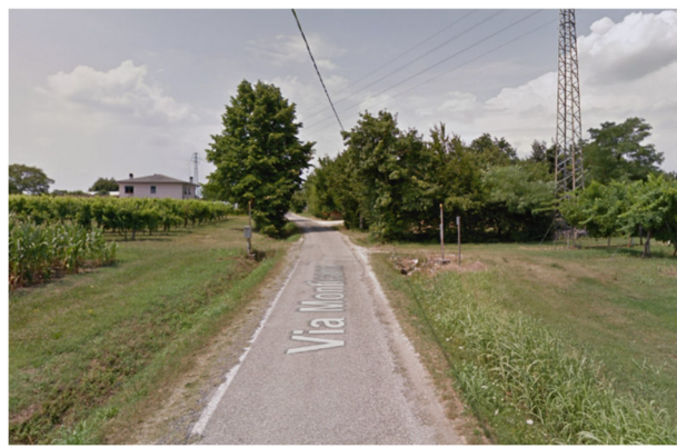
Foto2N – via Monticano