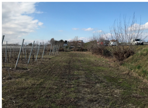
Foto2D - vista area agricola