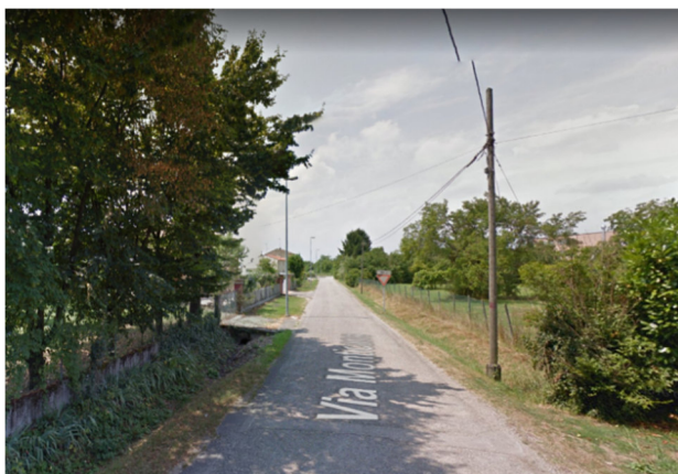
Foto2Q - via Monticano