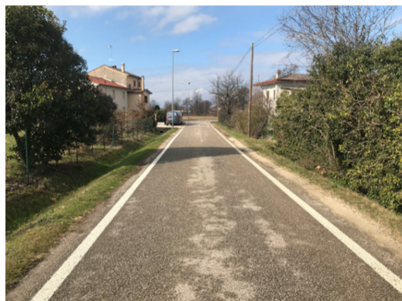
Foto2R - via Monticano