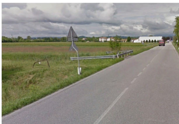
Foto3E - vista dalla SP15, attraversamento torrente Cervada