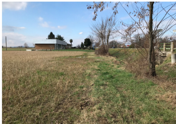
Foto3B - vista dall'area agricola