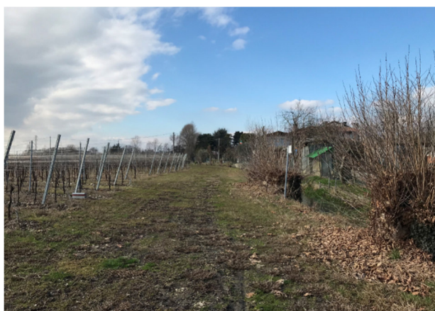
Foto2F – vista area agricola