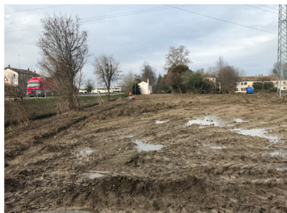
Foto 1D - area ad Ovest del fosso Musseretta