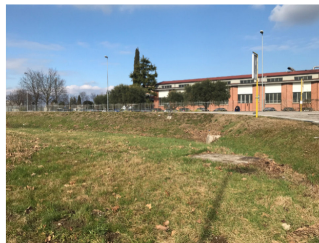
Foto2T - via Monticano