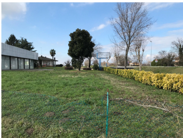
Foto3C - vista dall'area agricola