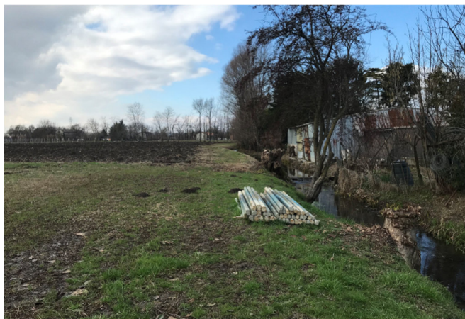
Foto2H – vista area agricola