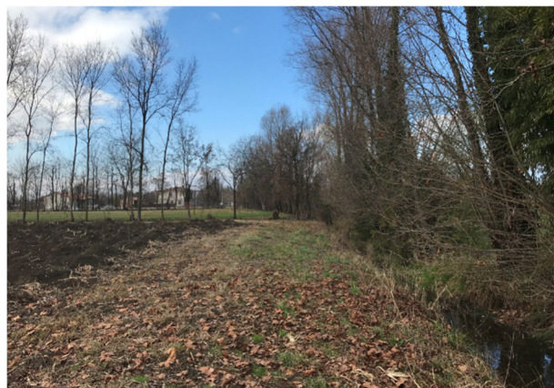
Foto2L – vista area agricola