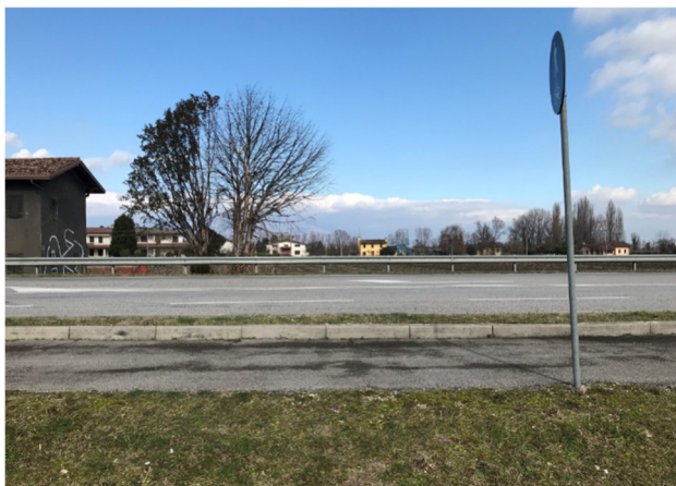
Foto2A – vista SP 15 attraversamento