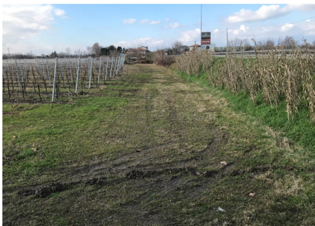
Foto2C – vista area agricola