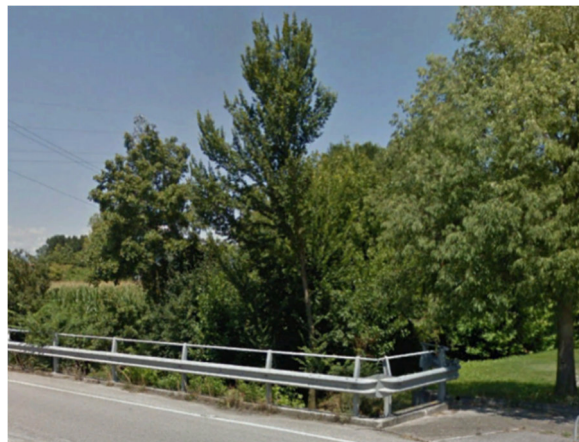
Foto 1B - vista dalla SP15, fosso Musseretta