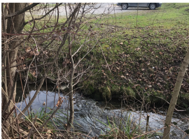
Foto 1C - vista da Est, fosso Musseretta