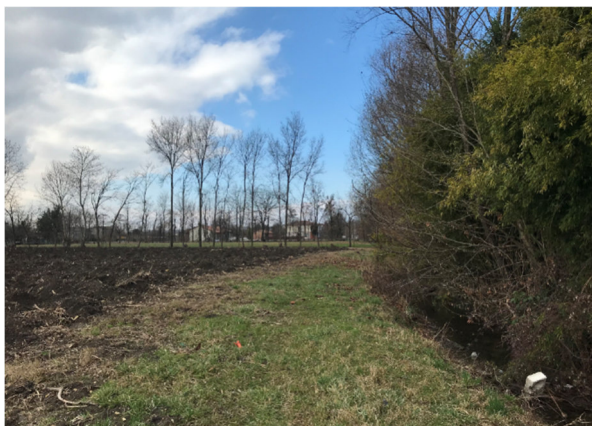
Foto2I – vista area agricola