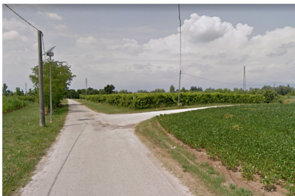
Foto2M – via Monticano